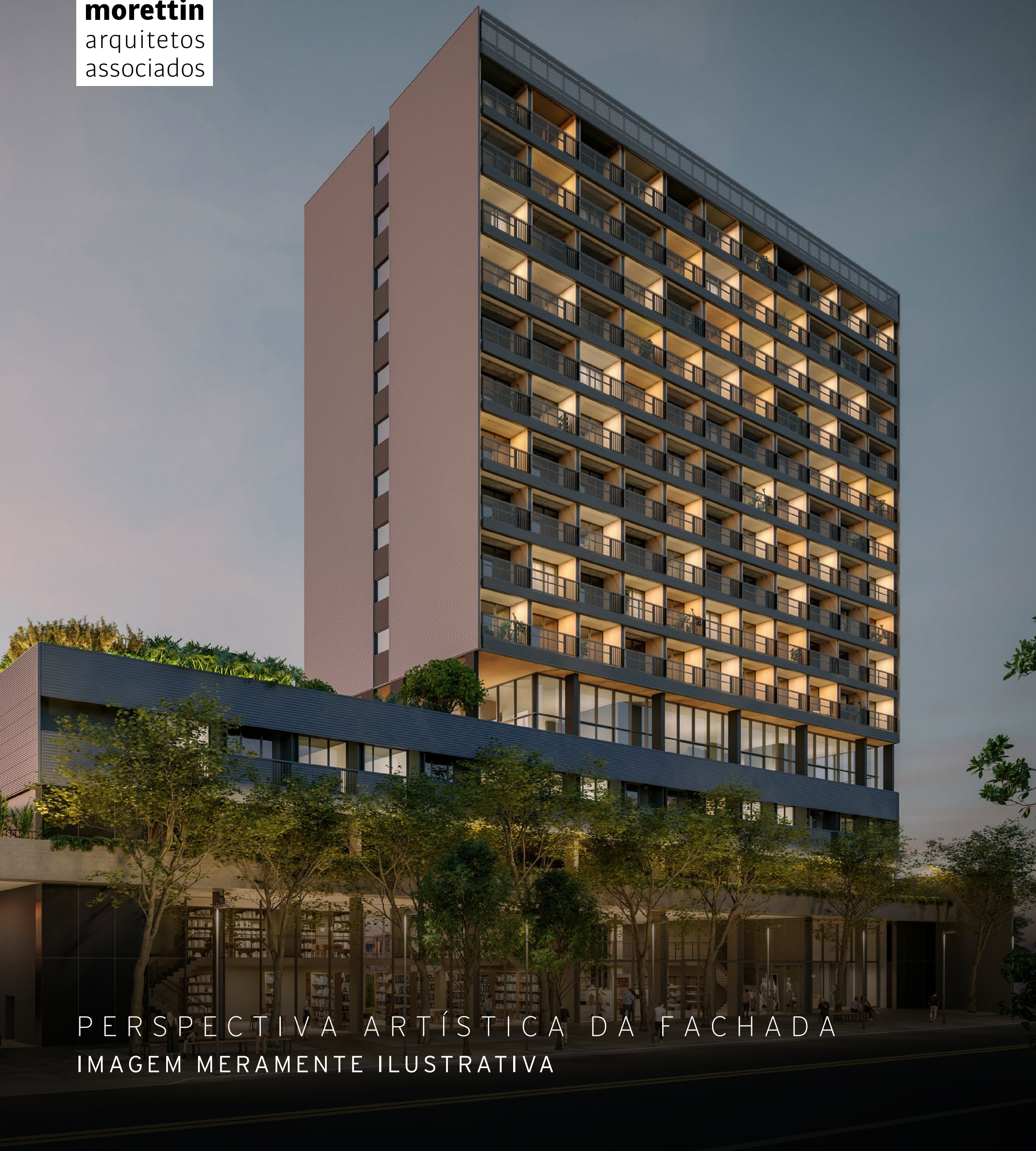
PERSPECTIVA ARTÍSTICA DA FACHADA IMAGEM MERAMENTE ILUSTRATIVA